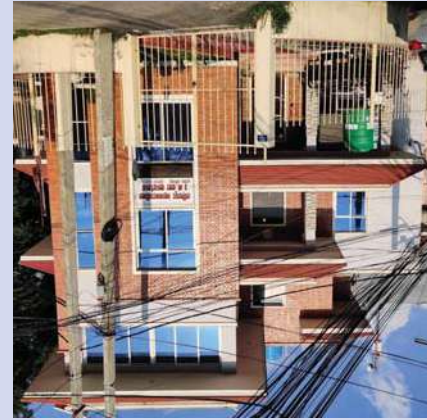
३ नं. वडा भवन कार्यालय

“जनता नेताको घरमा होईन, नेता जनताको घरमा ।”