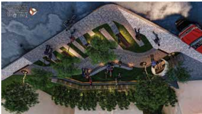
පුළුල් කොටසක් ලෙසින් පුළුල් කොටසක්

“සමස්ත දිගටම විකල්පයක් ලෙසින්, ‘සමස්ත’ සඳහා විකල්පයක් ලෙසින්.”