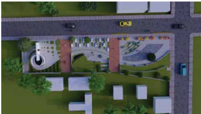
කොටසක් ලෙසින් කොටසක්