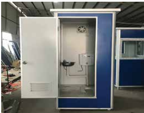
Movable Portable Toilet