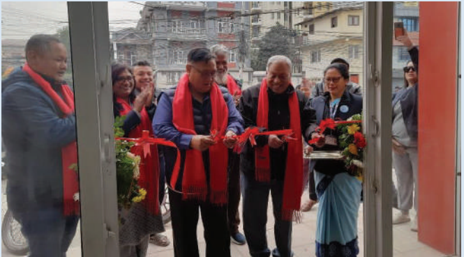
“हाम्रो घर” मा वडा महिला समूहद्वारा निर्मित विक्री केन्द्र

“वडा कार्यालयमा व्यवसाय दर्ता गरी मात्र व्यवसाय सञ्चालन गरौं ।”