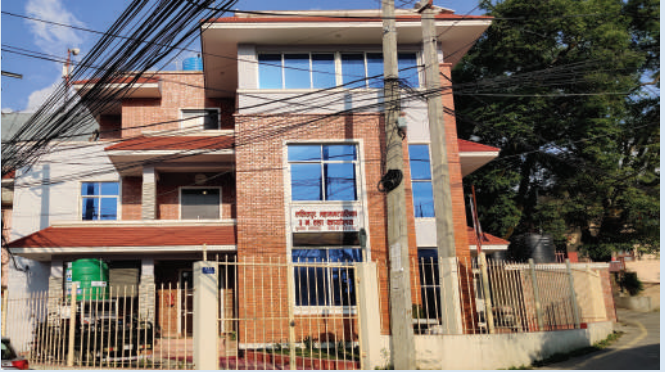
वडा कार्यालय भवनमा कार्य शुभारम्भ २०७५ जेठ १२ गते