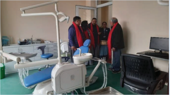
“हाम्रो घर” मा डेण्टल क्लिनिक