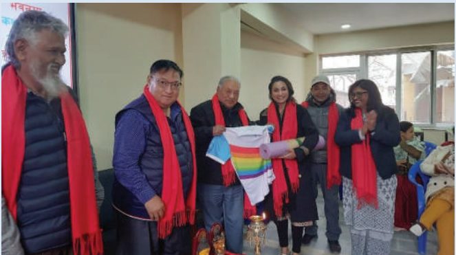
“हाग्रो घर” का योग शिक्षिकालाई योग सामान हस्तान्तरण

“वर्तमान कर्म हो, भूत सपना हो र भविष्य कल्पना हो ।”