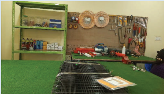
“हाम्रो घर” मा व्यावसायिक तालिम तथा मर्मत केन्द्र