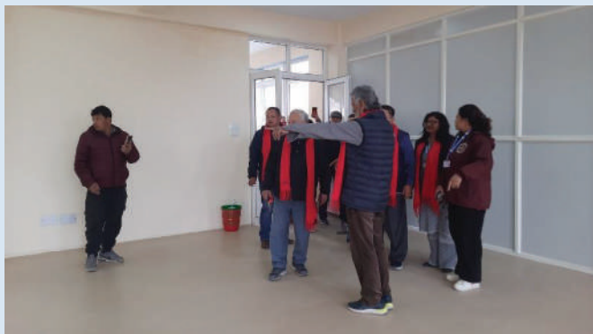
“हाम्रो घर” मा रहेको योग कक्षा