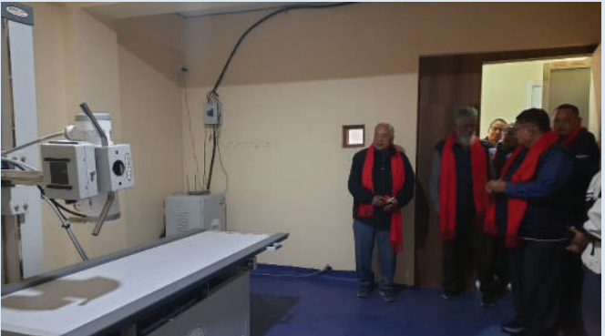
“हाम्रो घर” मा एक्सरे मेशिन

“मानिस तब मर्छ, जब उहाँको विचार समाजबाट हराउँछ ।”