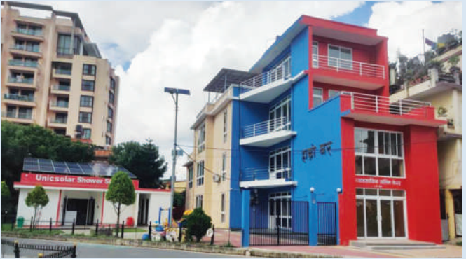
हाम्रो घर शुभारम्भ मिति २०८१ श्रावण ५ गते

“धर्म, संस्कृति र संस्कार हाम्रो पहिचान हो ।”