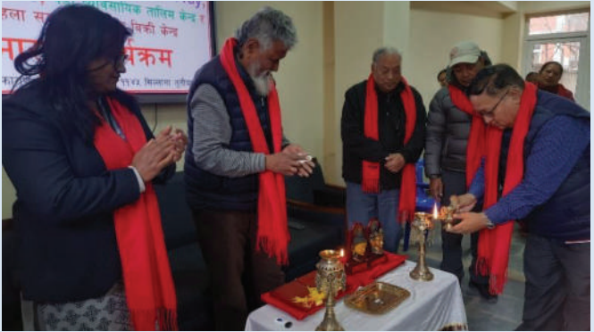
मिति २०८१/११/०३ मा “हाम्रो घर” भित्र हुने कामहरुको शुभारम्भ कार्यक्रम