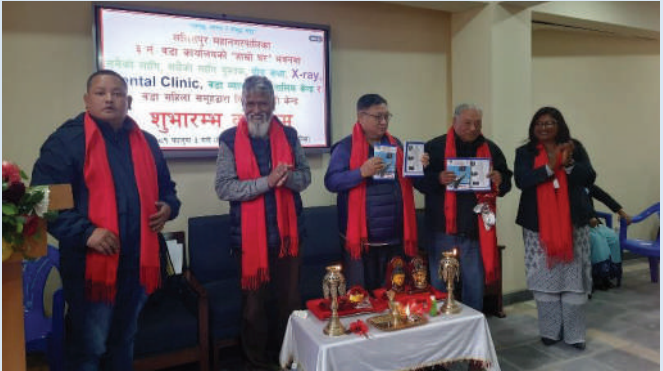
सबैको लागि, सधैको लागि पुस्तक शुभारम्भ